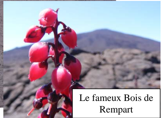
Le fameux Bois de Rempart

Votre guide, Diplômé d'Etat d'Alpinisme vous emmène pour une ascension mythique, celle du Piton de la Fournaise.